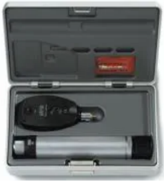
Oftalmoscópio direto BETA 200 S C-261 3,5V