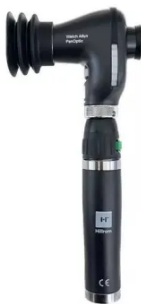
Oftalmoscópio PanOptic Plus LED com IEXAMINER

R$ 4.477,77 à vista com desconto ou 12x de R$ 494,99 com tarifa