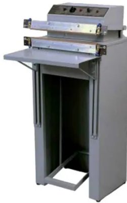
Seladora 400mm de pedal modelo XIV para termoplásticos